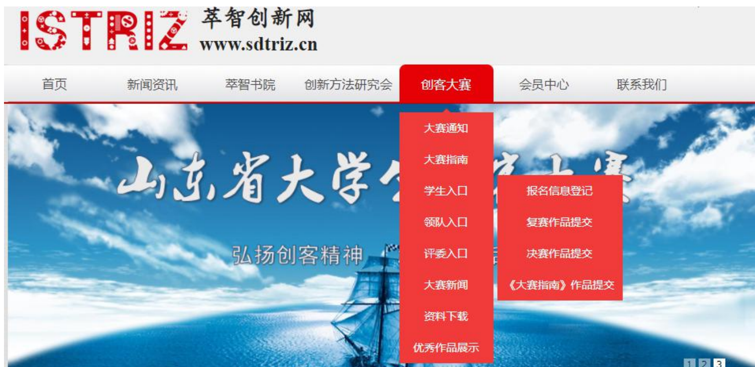
图 6 初赛报名入口