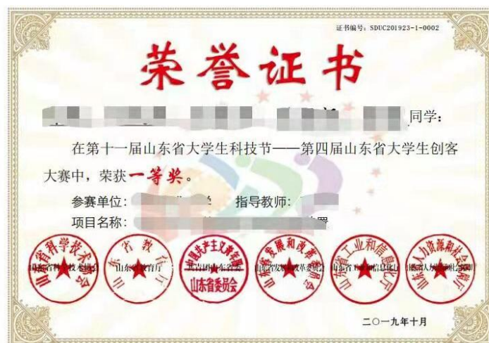
图14 大赛获奖证书样本

一、二、三等奖每个项目发放5张证书；一等奖每个项目另外发放2张优秀指导教师证书。